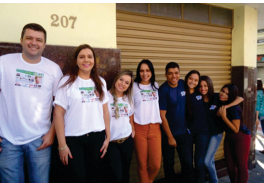
Equipe da ACE e da Rádio 98 FM durante o Pit Stop na Avenida Afonso Pena