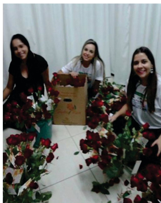
Equipe da ACE preparando as rosas com os cartões que foram entregues no Pit Stop

Foi realizado no dia 07/05(sábado) na Av. Afonso Pena o Pit Stop realizado pela Rádio 98 FM com o apoio da Associação Comercial e Empresarial de Campo Belo. Diversos locutores da rádio 98 FM estavam presentes na Avenida Afonso Pena (em frente a Loteria Monte Castelo) cujo objetivo do Pit Stop foi homenagear todas as mães e movimentar o comércio local. Foram entregues rosas e diversos brindes às mães e também a quem passava pelo local.