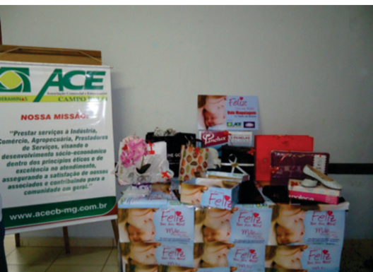
Prêmios que foram sorteados